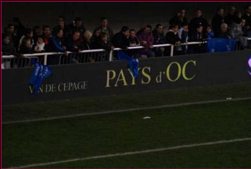
Panneautique tournante avec la signature « Vins de cépage Pays d'Oc »