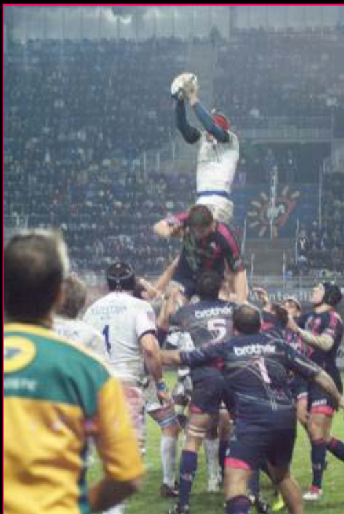
Photo illustrant une action du match faisant référence à l'accroche

« Duo Sprint » des AOC du Languedoc et des vins de pays d'OC installés à l'entrée de l'espace VIP