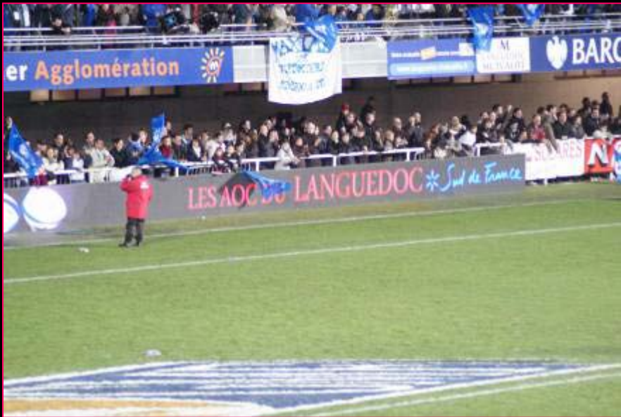
Panneautique tournante avec la signature « Les AOC du Languedoc » + la marque Ombrelle « Sud de France »