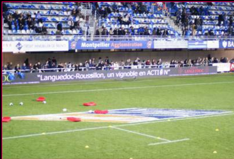
Panneautique tournante avec l'accroche « Languedoc – Roussillon, un vignoble en ACTION »