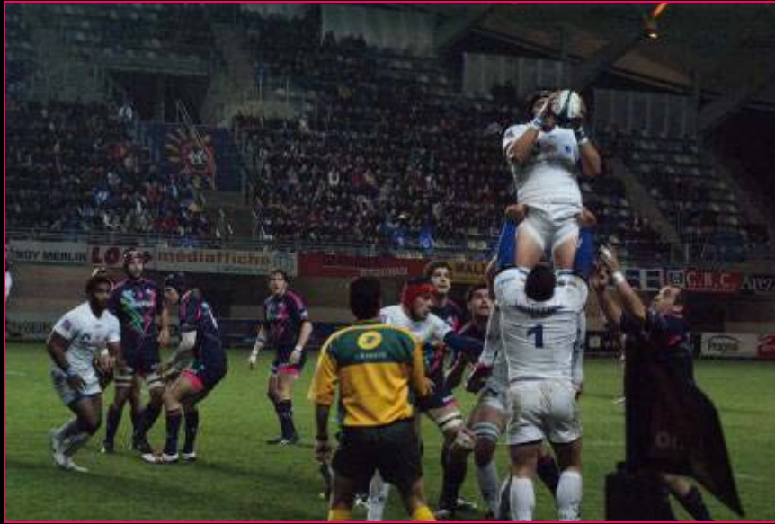
Photo illustrant une action du match faisant référence au slogan